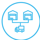
Bestands- und Lager- Verwaltung

über die Bestände an allen Standorten und bei allen Handelspartnern zu erhalten. Von der Luftfracht und dem Versand von Gütern bis hin zur exakten Behälterebene im Lager - nutzen Sie die vollständige Transparenz von Sendungen und Beständen in Bewegung.